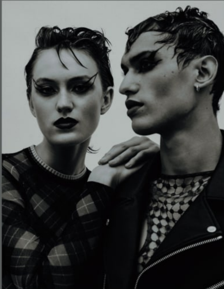
Jean Paul Gaultier long sleeve top Trousers self-made Belts Vintage, Archive Dr. Martens Boots