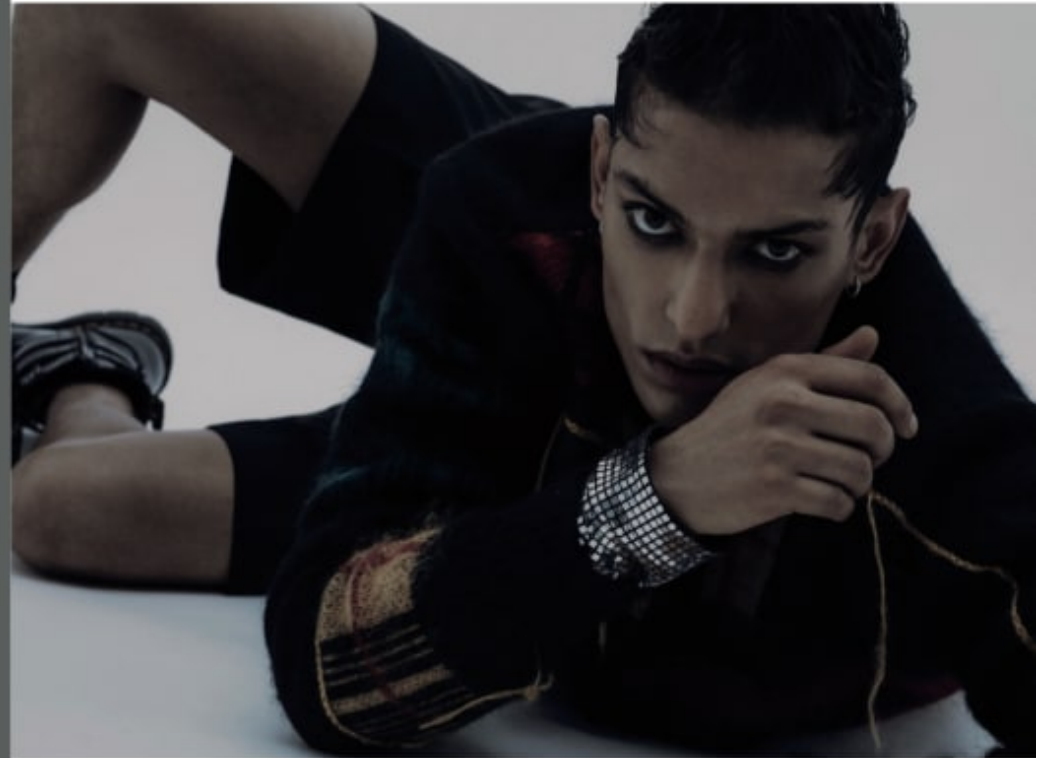
Calvin Klein Leather Jacket (Loews Agency) G Star Jeans (Bold Agency) Red Dress (Prag Agency) Dr. Martens Boots