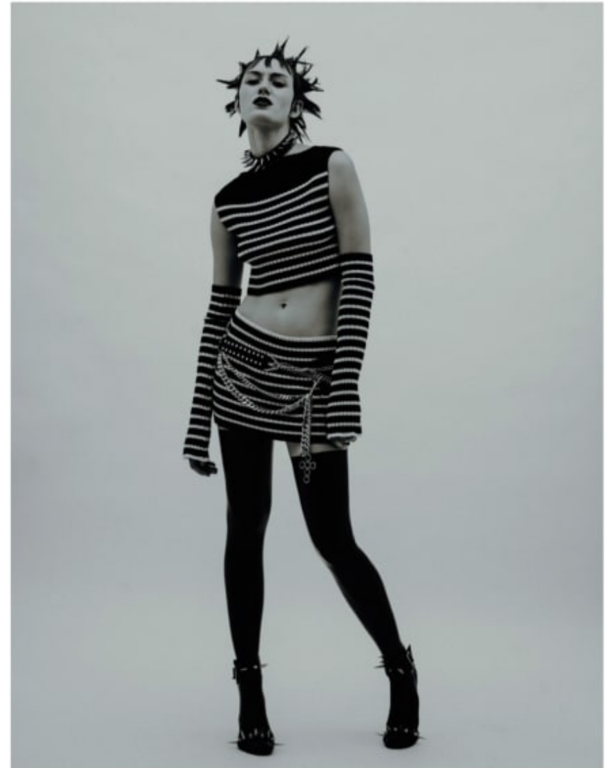
Vintage Knitted 3 Piece Jean Paul Gaultier